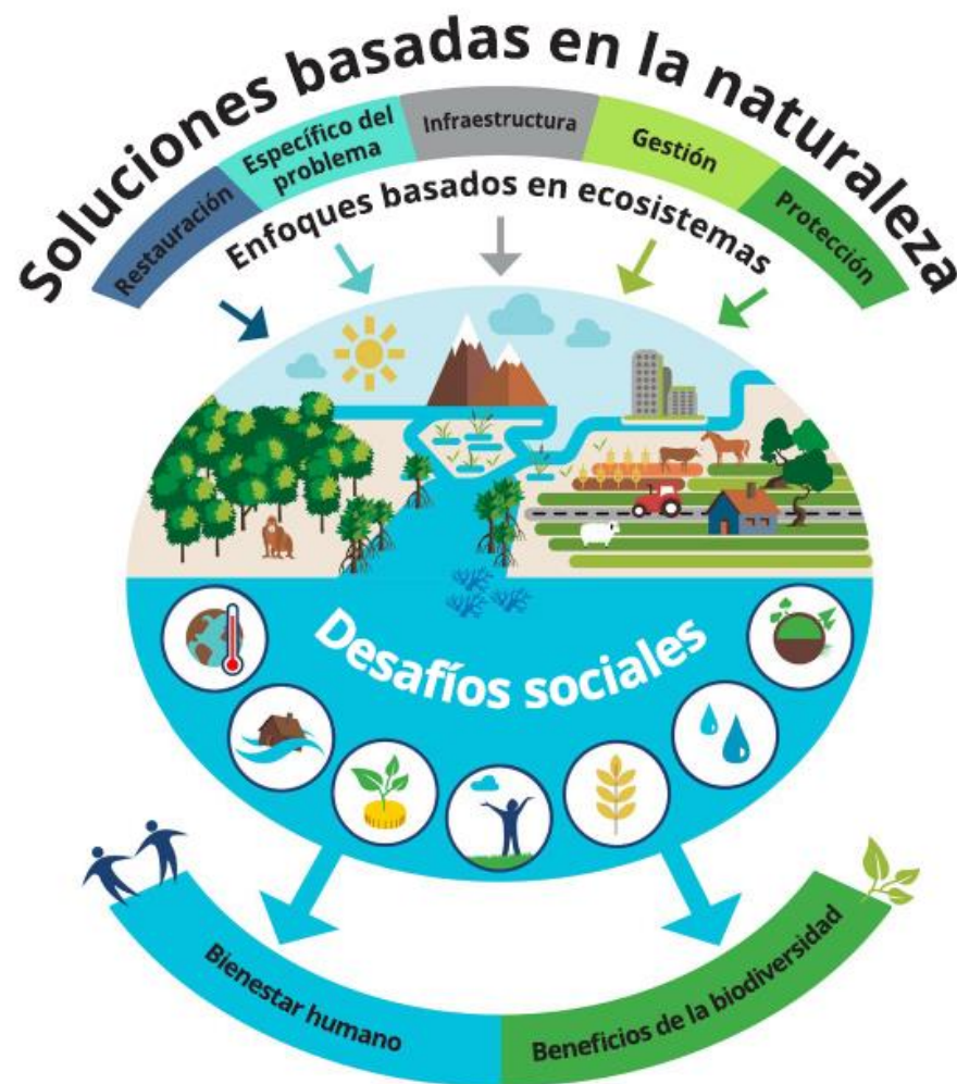
Figura 1. Soluciones basadas en la naturaleza (UICN, 2020)

ecosistemas naturales o modificados que hacen frente a los desafíos sociales de manera efectiva y adaptativa, proporcionando simultáneamente beneficios para el bienestar humano y la biodiversidad (UICN, 2020).